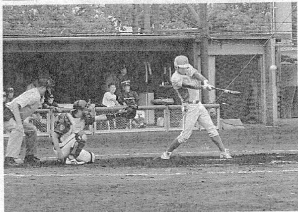
和歌山箕島球友会—パナソニック 八回表箕島球友会1死無塁、球に食らいつく松下—大阪府枚方市のパナソニックベースボールスタジアムで

(毎日新聞社・日本野 球連盟近畿地区連盟主 催)は20日、大阪府枚 方市のパナソニックベ ースボールスタジアム